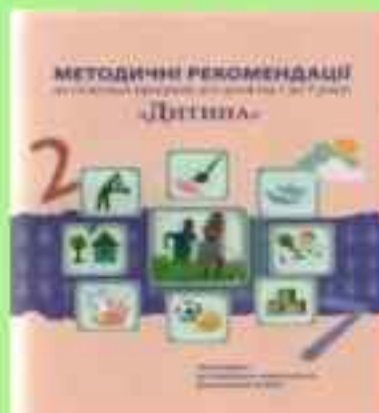
Дитина: Освітня програма для дітей від 2 до 7 років