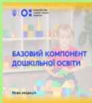
Базовий компонент дошкільної освіти (нова редакція)