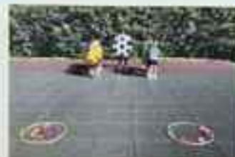
Перший беріг бачимо